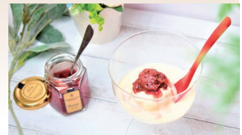
薔薇コンフィチュール(花びらのジャム) 「ふくしまおいしい大賞2016」大賞受賞