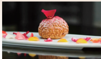
スイーツの花びらトッピング (都内レストランで採用いただいています)