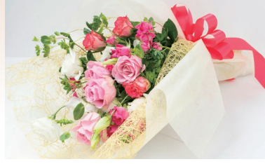
定番の花束やそのまま飾れるスタンド型など アレンジし全国のお客様にお届けしています。