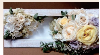
白く染めて。シックなイメージに