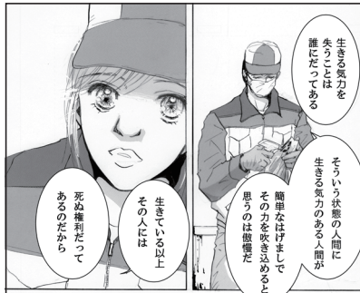
命の足あと 17話 本編シーン