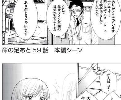
命の足あと 65話 本編シーン