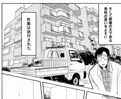
命の足あと 31話 本編シーン