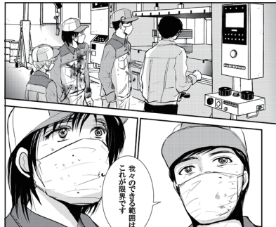
命の足あと 59話 本編シーン