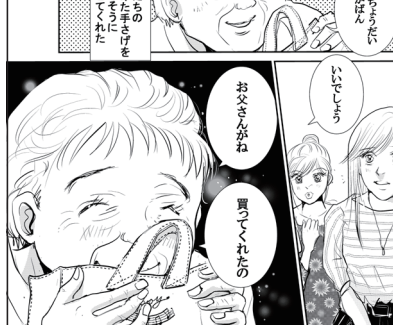
命の足あと 67話 本編シーン