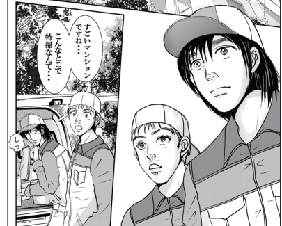
命の足あと II 10話 本編シーン

細く長く漫画を描いてきて、結局描きたいのは人間なのだと気づきました。昔と違い今はWEB配信という形でジャンルや年齢性別の垣根を超え色んな漫画が読める時代です。