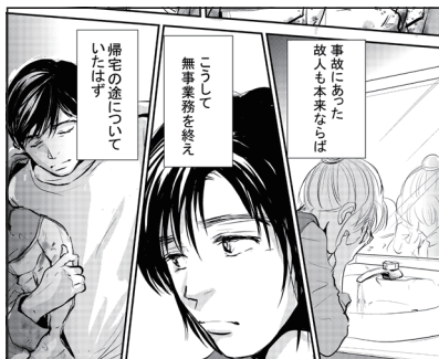
命の足あと 59話 本編シーン