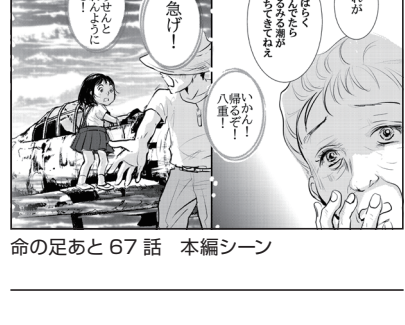
命の足あと II 10話 本編シーン